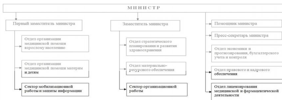
Рисунок 1. - Организационная структура Министерства здравоохранения Республики Башкортостан

Организационная структура Министерства здравоохранения Республики Башкортостан представлена на рисунке 1.